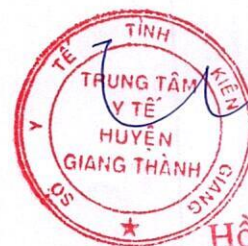
Hồ Hữu Phước