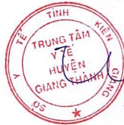
HỒ Hữu Phước